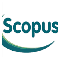
Scopus Medline (Ovid)