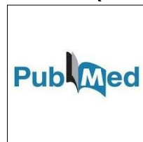
PubMed Web of Science (ISI)